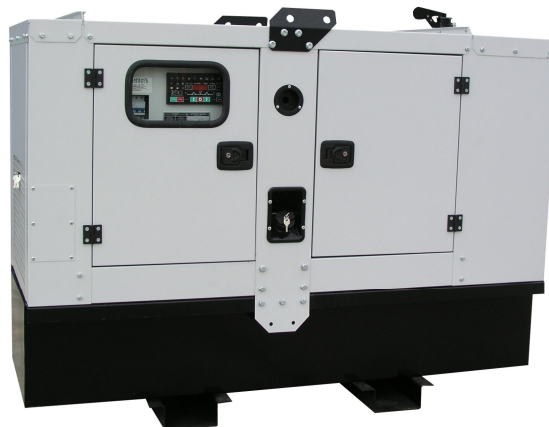
Με Ηχομονωτικό Κάλυμμα