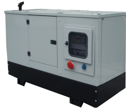
Με Ηχομονωτικό Κάλυμμα